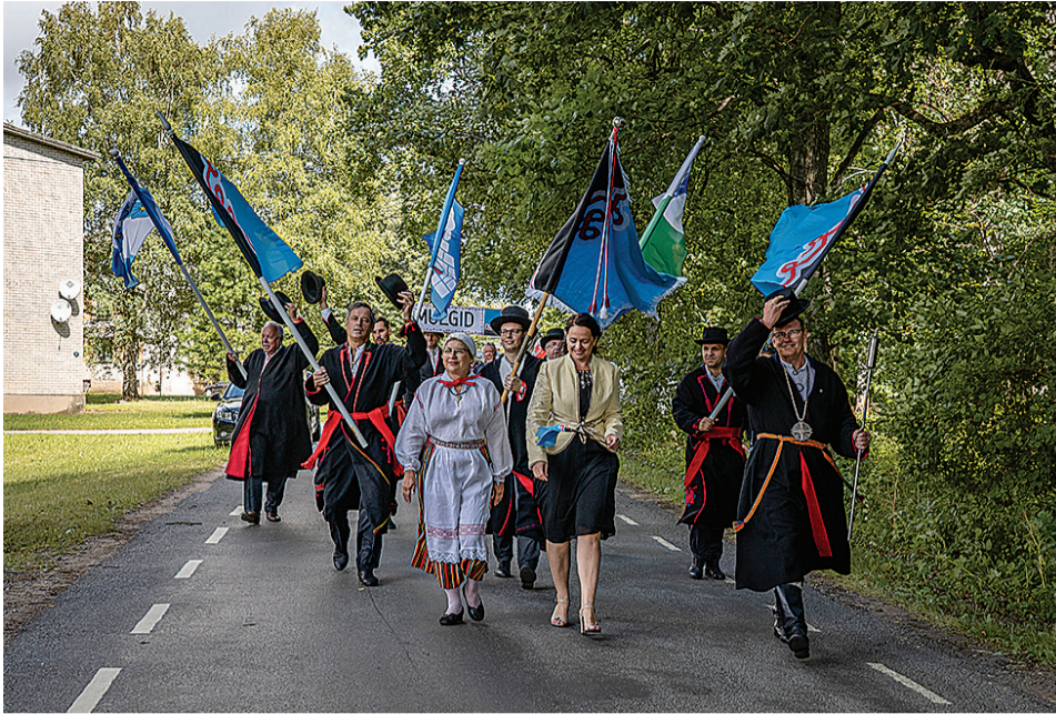
Pidupaika minti pikän rongikäigun läbi Karksi pargi.