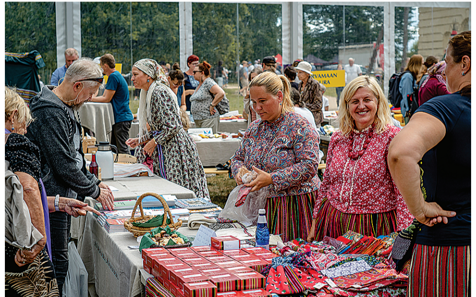
Terve päev olli valla suur õimutelk, kus soomeugrilase lähembelt ja kaugembelt saive oma asjust kõnelde ja kaupa müvvä.