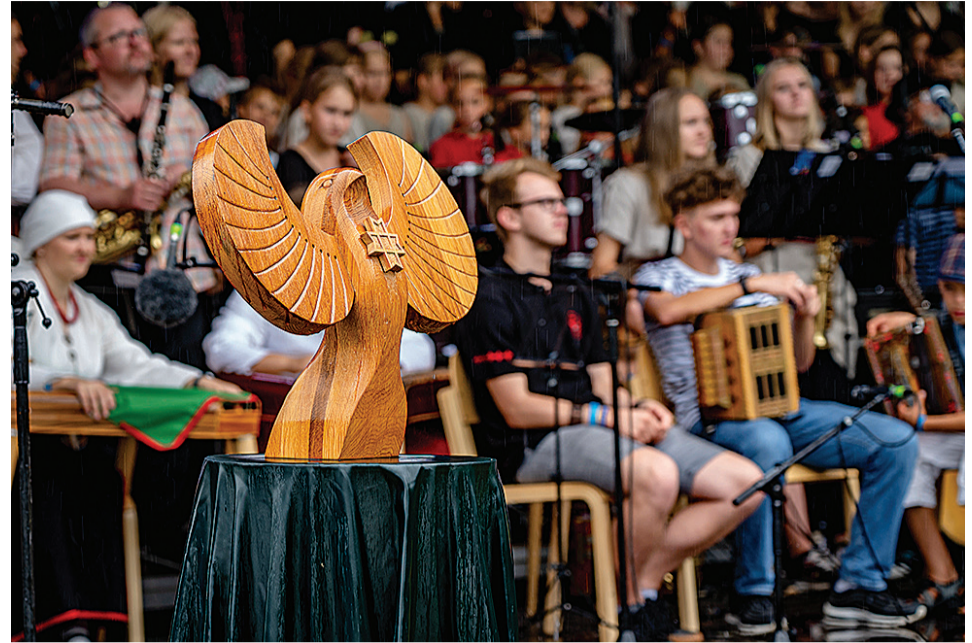
Karksin olli ka soome-ugri Sirk, kes aukotusse päätt kigi piduliste üle valvas.