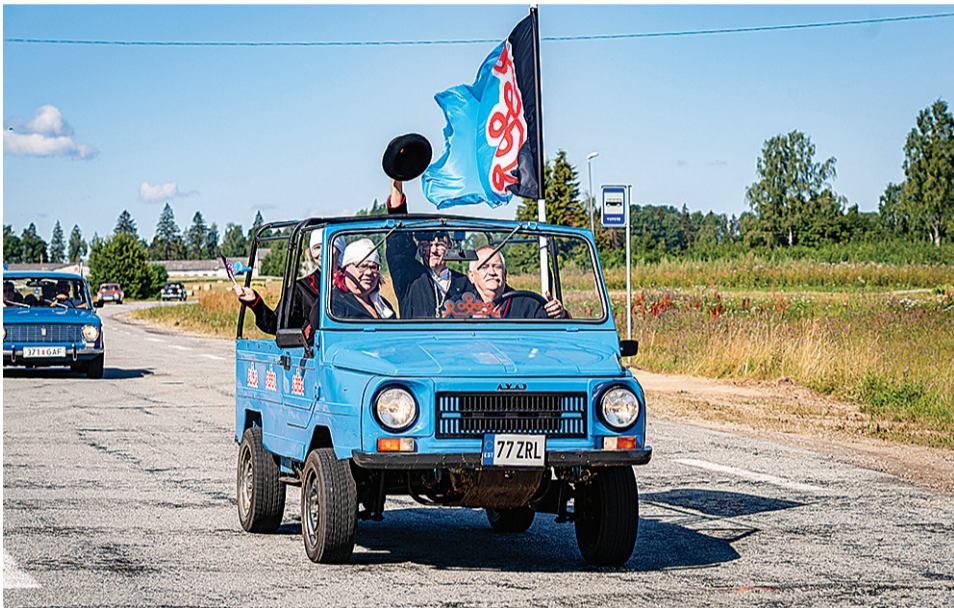
Pidutuli panti palame 24. juulil Härjassaare mäe pääl ja viiti vanade autudege üle Mulgimaa.