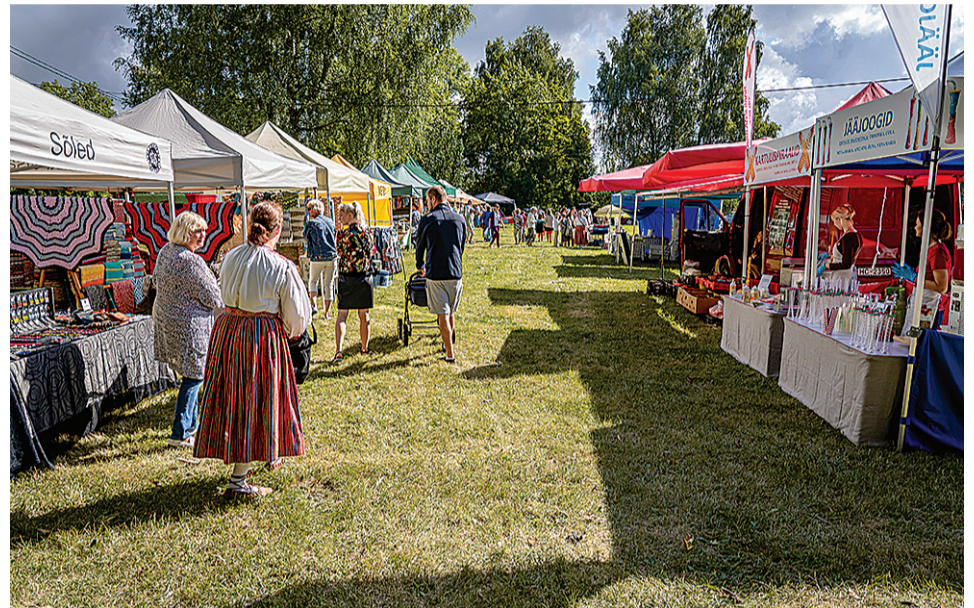
Pidupäev akas ommuku pääle suure laadage, kos sai osta ja müvvä egätsugust käsitüüd ja talukaupa.