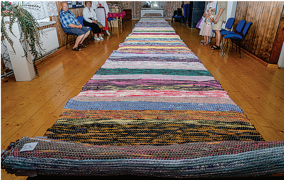
Karksi külämajan sai valmis õimuvaip, mida kudas poole aaste sihen ümäriguld 400 inimest ja pikkust tulli 10,5 miiterd.