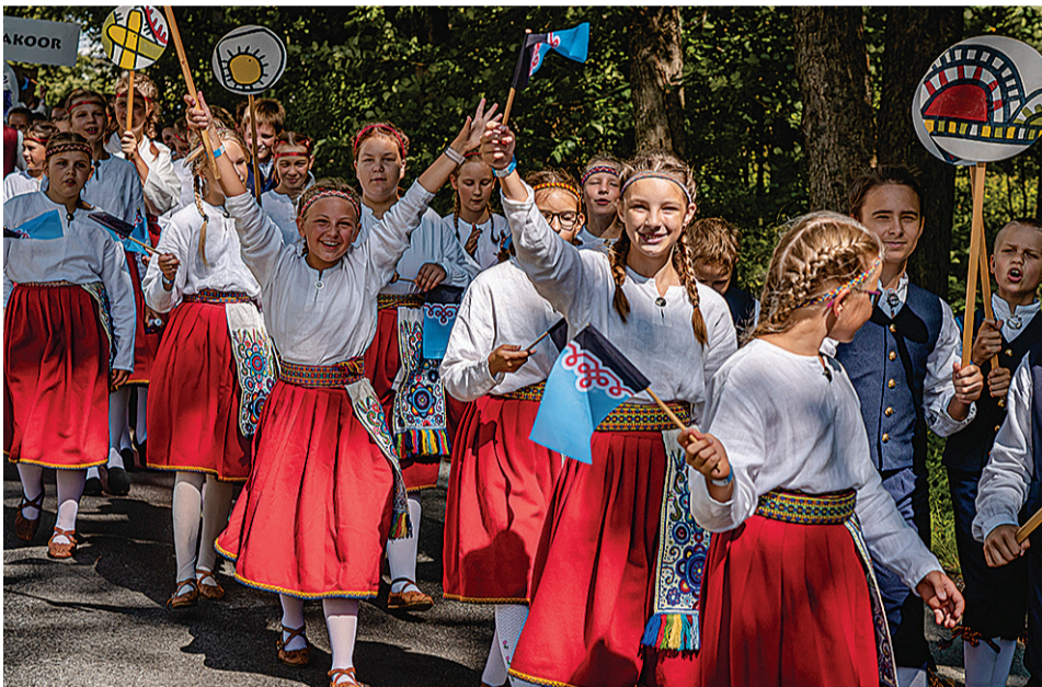
Kitzbergi gümnaasiumi 4. lassi rahvatantsurühm rongikäigun. Tuju om pidune.