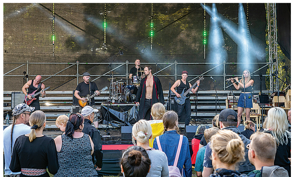
Ansambel Nikns Suns meelit püüne ette simmanile ulka nuuri.