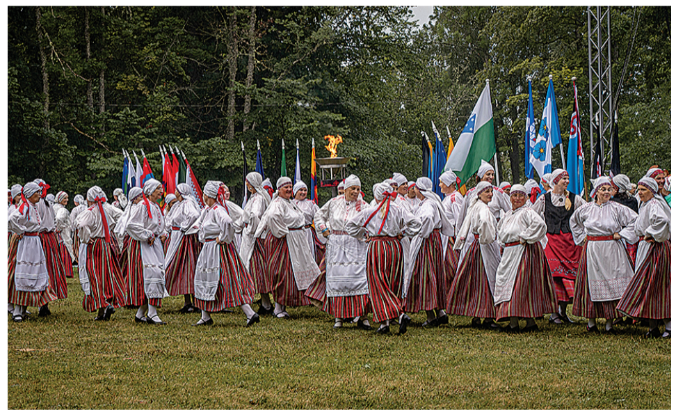
Paistku päe või kallaku vihmä – Mulgi naise tansive iki.