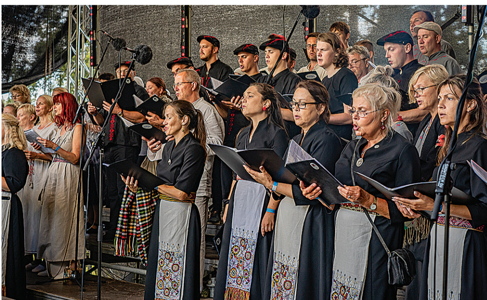
Mulgi segäkuur olli pidupäeväl püüne pääl laulman ja nädäl ennemb pidutuld läbi Mulgi-maa saatman.