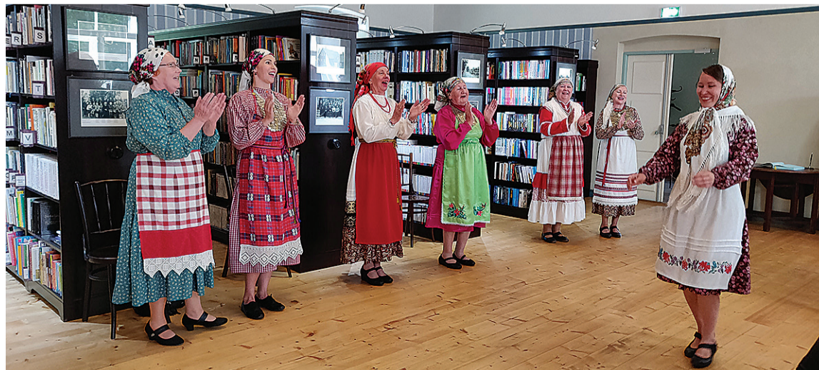
Udmurdi ansambel Ošmes panni o Kulla Leerimaja pörmandu pörume ja rahva rõõmust rõkkame.