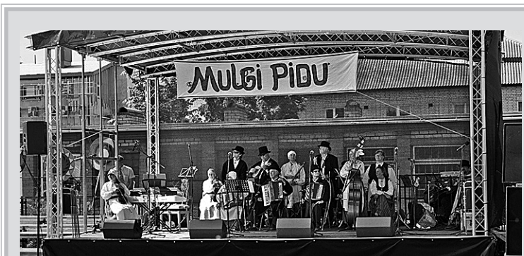
Ku äste lääp, saap tulevaaste Mulgi pidul joba peris uusi laule laulda.