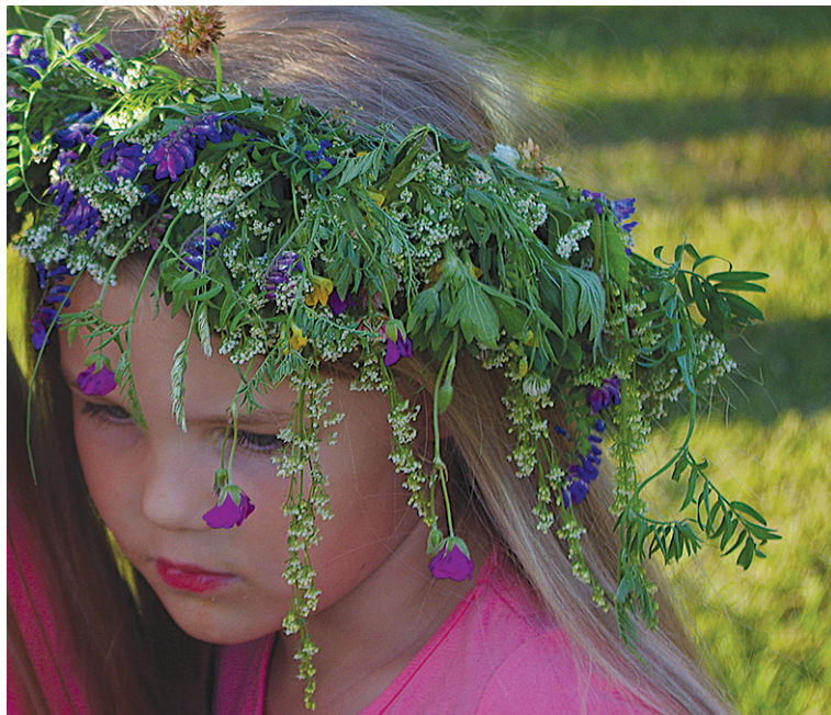
Jaanipäeväl tulep tetä ütessast eri sorti äitsmest lillirants.

Jaanipäevä manu käip egät-sugu nõiduslikke toimetusi kah. Näütuses sõnjalaaitsme otsmine. Sõnjalaaitsset tulli otsi mõtsan ütinde, selle man es või pelläte võõrit ääli egä olevusi. Es või kah kutsmise pääle ümmer käändä egä vastu kõnelde. Lõütü äitse tulli pa-