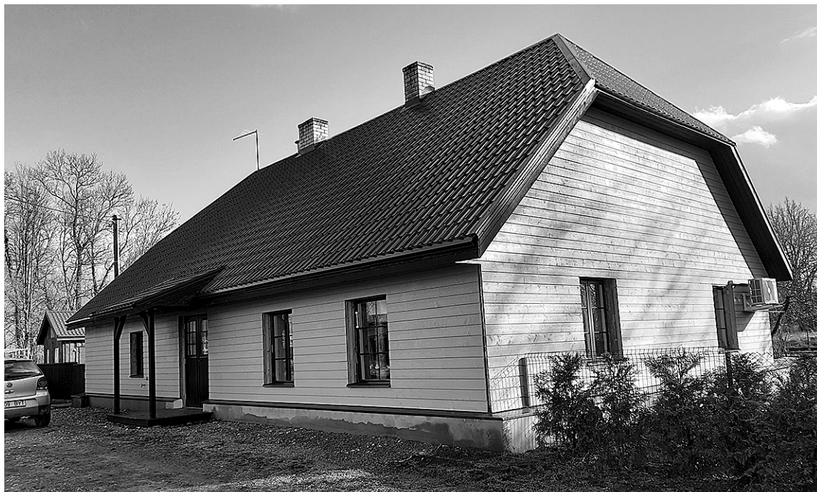
Meire taluäärbän Kalme külän om iluste kõrda tettü.