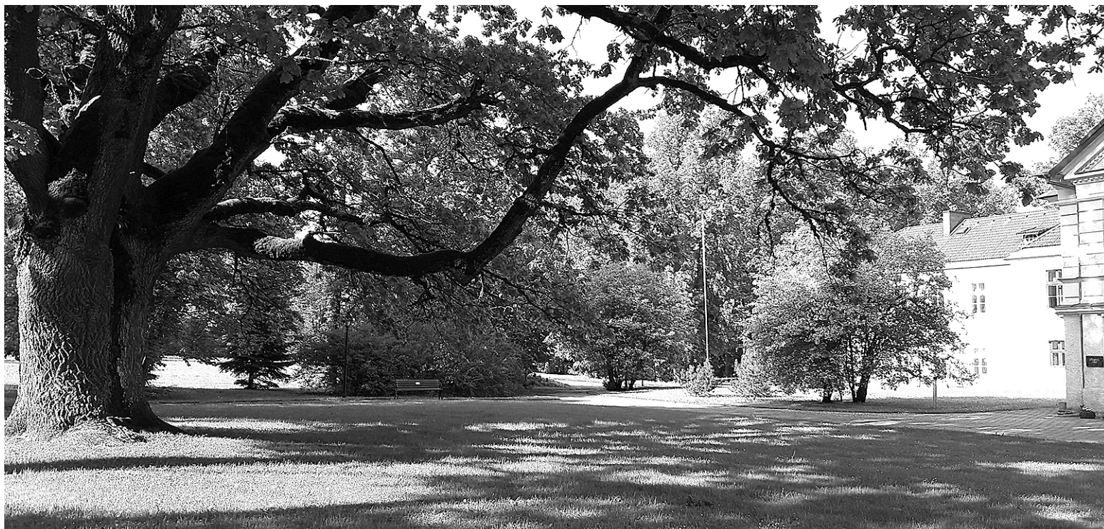
Kärstne mõisa ihen jääp kohe silmä ilmama jäme tammepuu, millel arvates vanust olevet ligi 400 aastet.