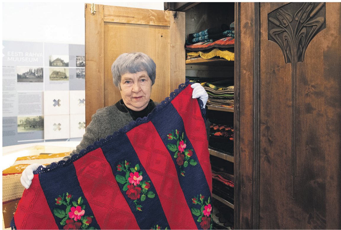
Raua Anu süämeasjas om õpete inimesi nägeme ja indame vanu rõõvit ja nende ilu.

Selle väikse Kihnu poole kaemise perän võis minna mõtten ulkma mulgi mustremaie pääl, päevä kätte liikma pant linapalajide ja neist õmmelt amide ja rüüde vahele. Sedä lina värki ju mulkel jakkup – esiende jaos, müügis ja rikkuse kodukandmise jaos kah. Linapäätük