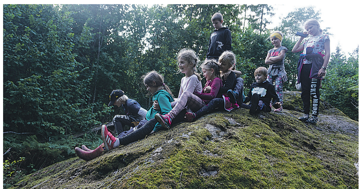
Lilli luudusmaja uviringi latse livakivi pääl liugu laskmen.