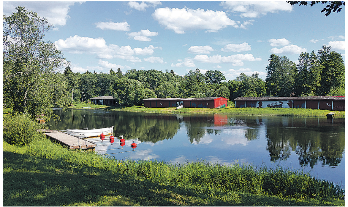
Vaatemist väärt kotussit om Mulgimaal küländ. Pildi pääl om Ohne jõgi ja paadikuuri Uvve-Suistle mõisa all.

Järgmine ja perämine Mulgimaa turismilaani arutemine, mis võtap kik eelmise kokku, tulep 28. mail Eesti Maaülikooli Polli aiandusuuringide keskusen. Sinna om oodet Mulgimaa turismige seot ja sellest uvitet inimese. Laan saap valmis ütten-