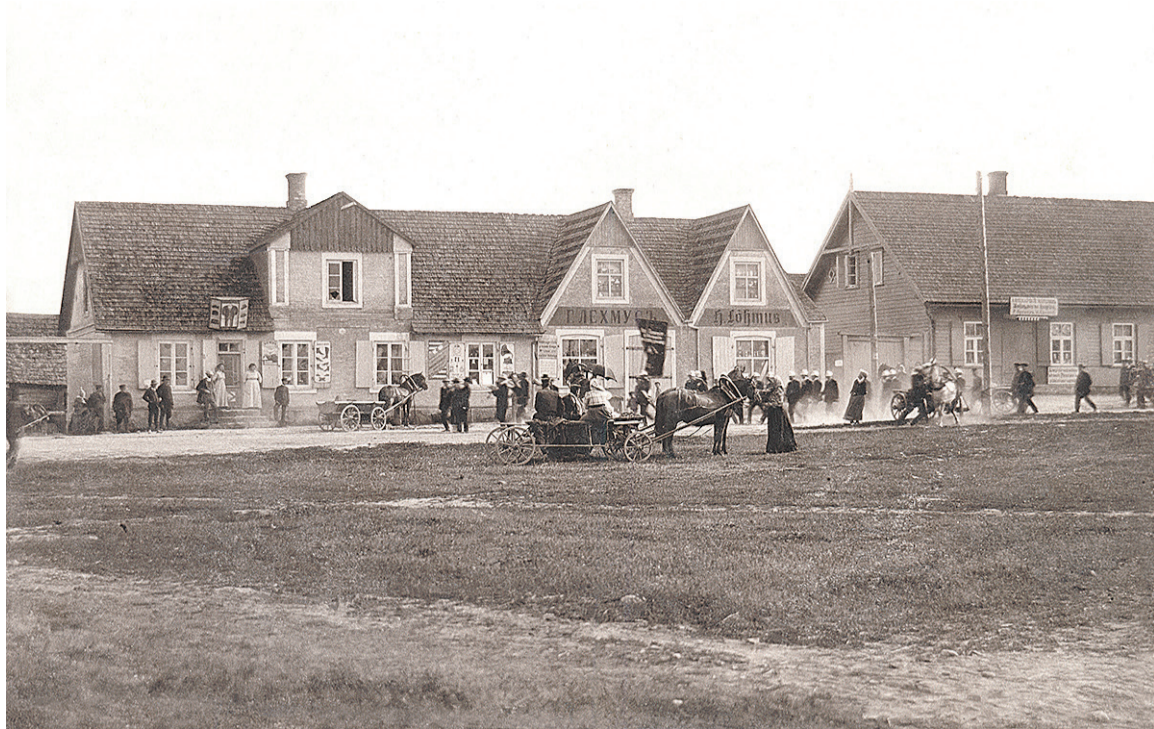
Abja-Paluoja Pärnu uulits 20. aastasaa akatusen. Pildi pääl om Lõhmusse äri, mes ollive praegutse Konsumi poodi asemel.