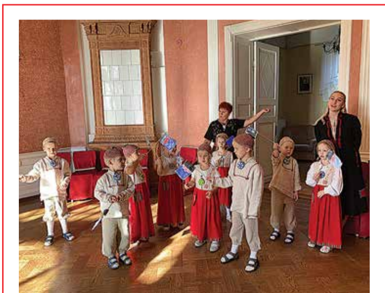
Et kige tillembe mulgi kah mulgi nädälist osa saas, ollive 15 Mulgimaa lasteaian 5.–16. oktoobreni omakultuuriommuku, kos ütten Laande Allige lauleti ja mängiti mulgi keeli. Pildi pääl om Tarvastu lasteaia Kärstne maja latse, kes ollive pidupäeväs esi omal Mulgimaa lipu kah tennu.