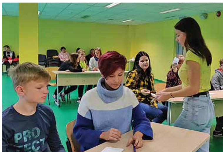
Koolinoorde mälumäng "Nupute" vällä tõi Abja gümnaasiumise päid murdma kuus punti viiest eri koolist. Ihen Tarvastu võistkond.