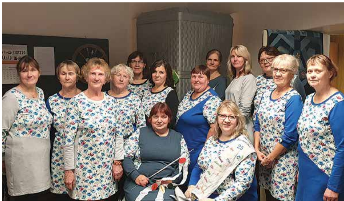
Riidaje käsituuringin käip kuun ümäguld 15 naist. Pidupäeväs ollive kik omal uvve lillilise leidi tennu.