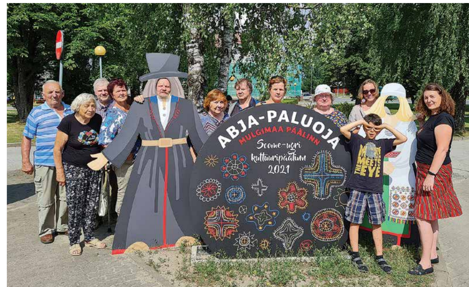
Tarvastu mulgi keele ring käis suvel Mulgimaa päälinnan ja Mulgi vallon uvireisil.