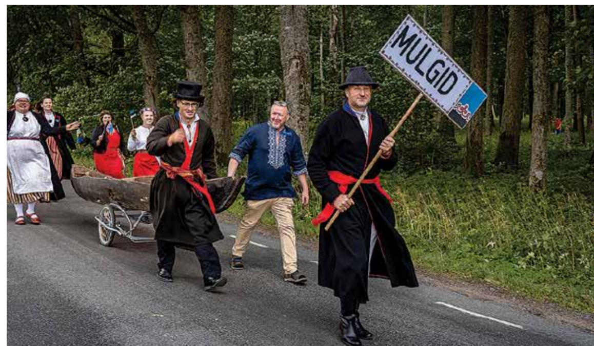
Üts selle suve suurembit ettevõtmisi olli Mulgi pidu, mes peeti Karksi pargin. Pildi pääl om rongikäik, kos ihenotsan ollive iki mulgi esi.