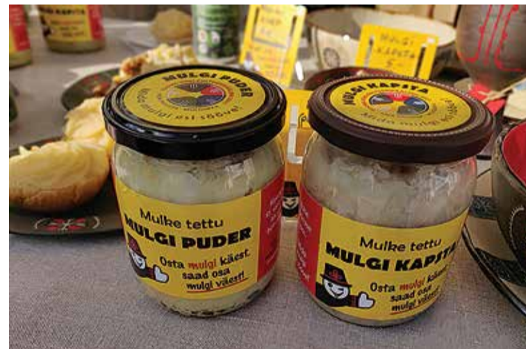
Mustla kohvikun tettu Mulgi puder ja Mulgi kapsta ollive purki pant ja uhke mulgikiilse sildi pääl leebit.