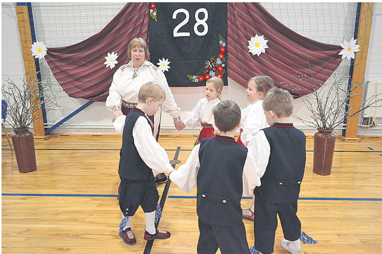
Perimuspäeväs ollive tillikse mulgi iluste pidurõõvise säet ja mängsive ütten oma õpetejidege läbi ulka mulgikiilside laulumänge.

Siikördse perimuspäevä teema olli “Laste mängu ja laulu läbi aaste”. Nendest laulest ja mängest tulli vällä, ku tugev köüdus om inimesel luudusege. Ja nigu iki, mahtusi päevä sissi raasike nalla kah. Punamütsike ja Susi tõive lastel selles päeväs pallu rõömu. Kik laulumängu ollive mulgi keelen. Ummuli lastel ollive miilt müüdü “Kevädlaul”, “Kirjätlemä mäng”, “Lustimäng” ja “Kun om miu koduke”. Tõrva Mõmmiku lasteaida Karumõmmi rühmä laste oodassive perimuspäevä joba pallald sõidu peräst. Abja Kastanide rühm tund kah rõömu reisust ja joba sõidu aal võeti laul üles ja iki mulgi keelen. “Tõrva kandist Paistu tullu lastel olli ää vaade varakevädise Mulgimaa eri kotuste pääle, mes kigil lastel uvi pakk,” kõnel Tõrva lasteaida Mõmmik juhateje. Kigile miildus väega sii, et