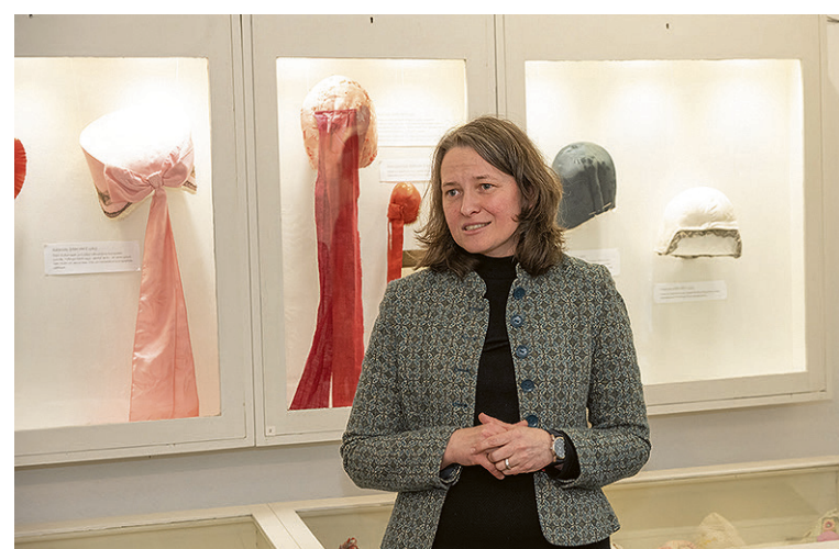
Üits näituse kokkusäädjiti Tubin McGinley Tuuli.

Kokku om Eimtalin vällä pant puulsada pääkatet ja neid kikki saap kaia 1. juunini. ÜM