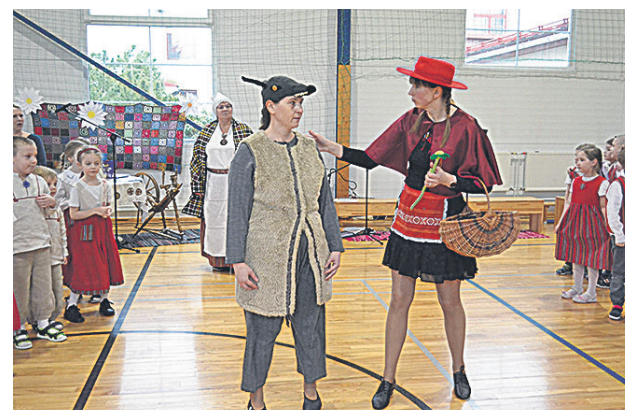
Pidule ollive tullu Susi ja Punamütsike kah.