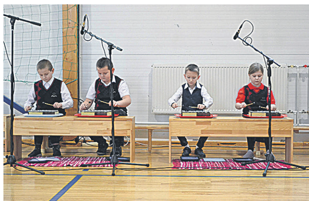
Paistu kooli laste mängsive pidulistel plaatpille.