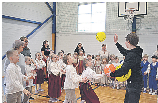
Õhupalli tõive kigile pallu rõömu.