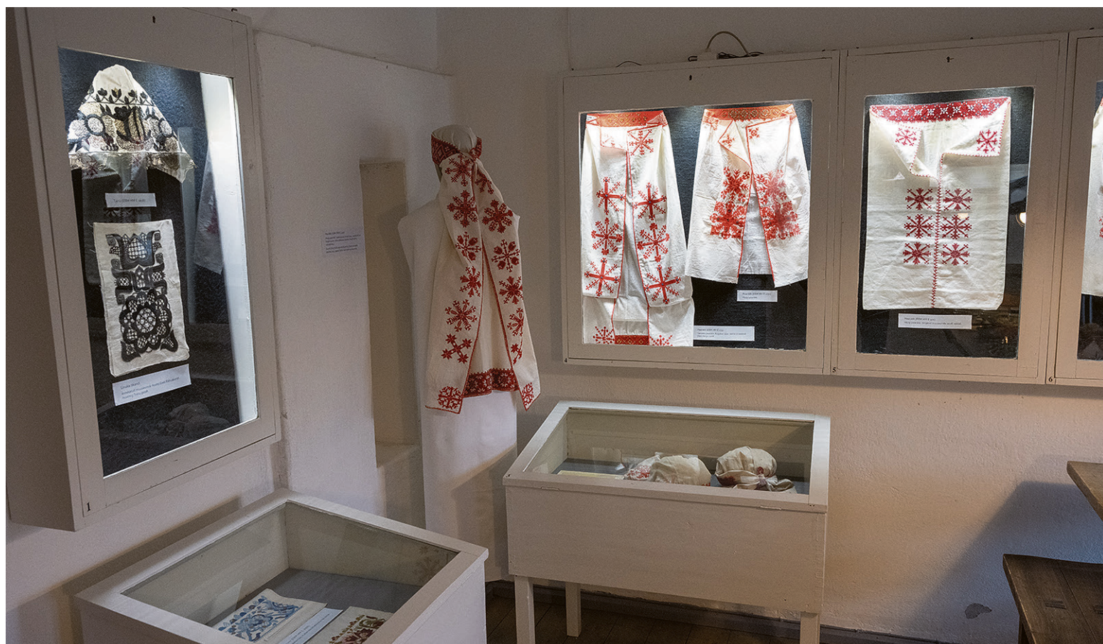
Uhkembidel mulgi rättele om nii ülemise ku alumise veere pääl punatse maali ja esiki külge pääl uhke tikandi.

Mulgi naistel olli muduki erisugust rätte – tüü jaos lihtsambe, pidu jaos uhkembe. Mõnikörd seoti rättele viil uhke sii-