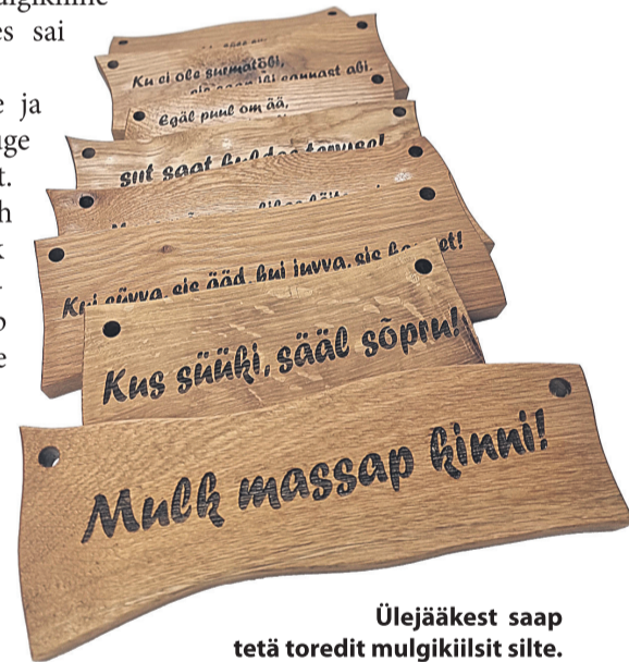
Ülejääkest saap tetä toredit mulgikiilist silte.