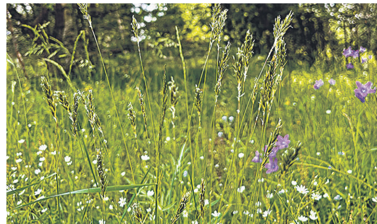
Lõhnav maarjaein om esieräligu väge taim.

Maarjaeinätii avitep nõrkuse ja venituse kõrral. Maarjaeinäl arvati olevet esierälik vägi ja ta olli tähtis taim eestlaste mui- nasusun. Üits võimalus õnne ennuste olli siande: maarjaei- nä kõrre panti ahju levä sissi. Ku kõrre kõrbume lätsive, sis olli surma pelläte, ku es lää, sis olli elun õnne. Maarjaeinä vägi pidävet aviteme varandust löüda, linnukiili mõista ja luk- ku pant ussi valla tetä. Näituses