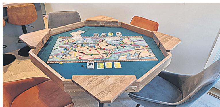
Üits Puumihe põnevembit tüüsit om ollu kokkupantav lavvamängu- laud.