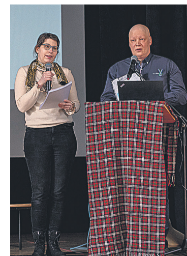
Mednis Jānise liivikiilse ettekandepanni püüne pääl mulgi kiilde Tominga Marili.

Leskova Piret Mulgi Kultuuri Instituudi juhateje Mulgi kiil: Ilves Kristi