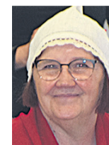
Umbleja Imbi Mõmmiku laste- aia lauluõpeteje

Sii olli üits tore pidu. Me arjume enne lastege neid laule lasteaian ja sii olli peris lõbus. Rühmän om esiki kaits Ukraina poissi, a nemä arjutive kah oolege ja saive akkame. Latse iki mulgi kiilt väige äste ei mõista, kigepäält aruteme iki läbi, millest jutt om ja alle sis akkame laulma või tansma. Järgikõrdamisege jääp ju kige parembine miilde.