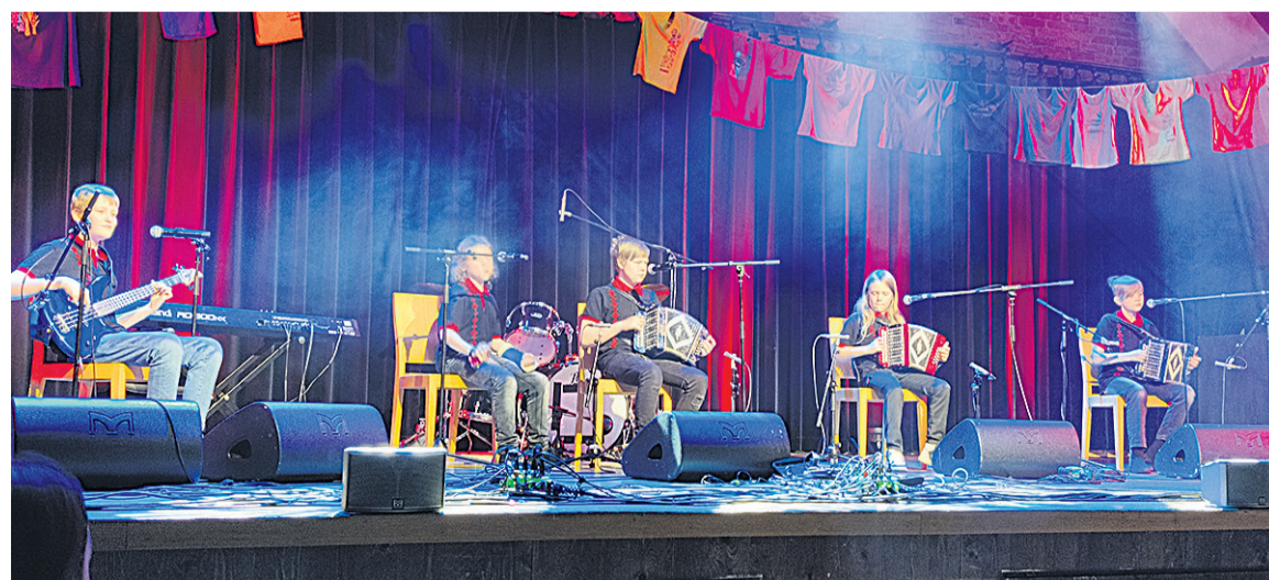
Ansambel Lõõtsanoobid Villändi perimusmuusika aidan püüne pääl.

Kik nii kolm poissi om Karksi-Nuia muusikakooli ansambli Lõõtsanoobid liikme. Oma pundige võtve na sii aastet osa võistelusest Noor Pärimusbänd