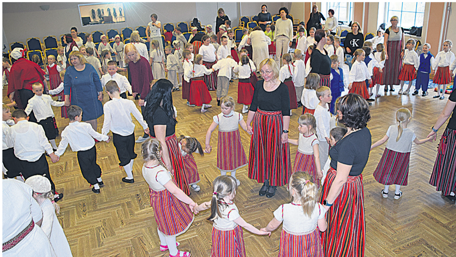
Mulgimaa laste 26. perimuspäeväle Karksi-Nuia kultuurikeskusele olli tullu üle 200 laste üten oma õpetejege.