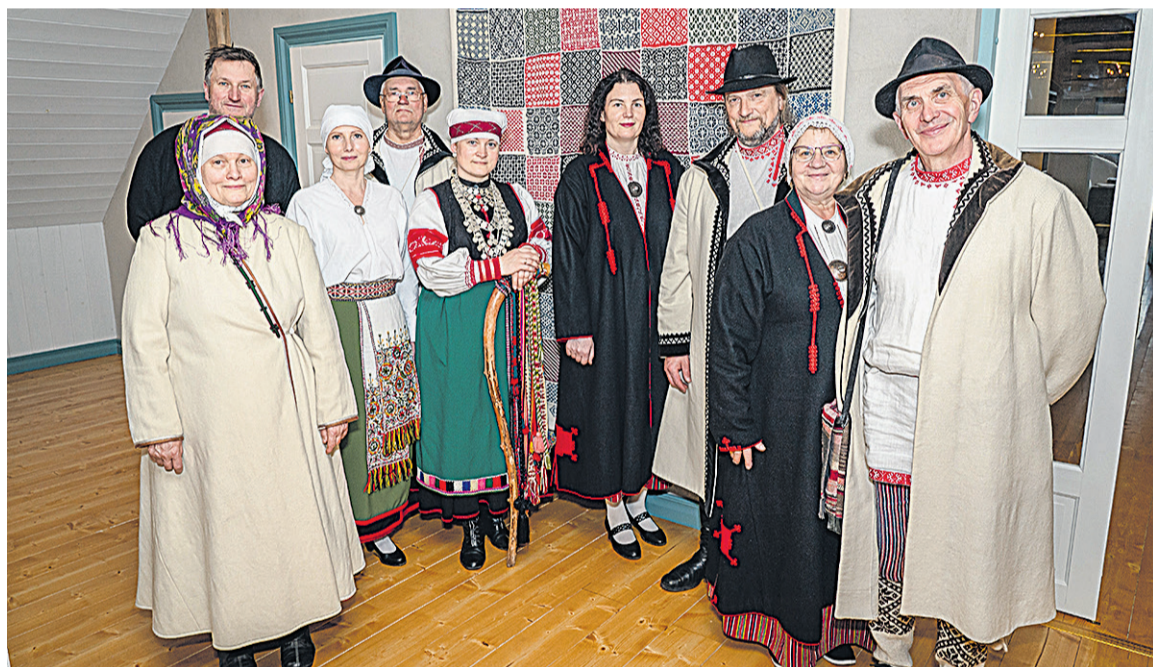
Kulla leerimajan tetti mulke ja setude ütine pilt Mulgi kindakirjalise lapivaiba man.