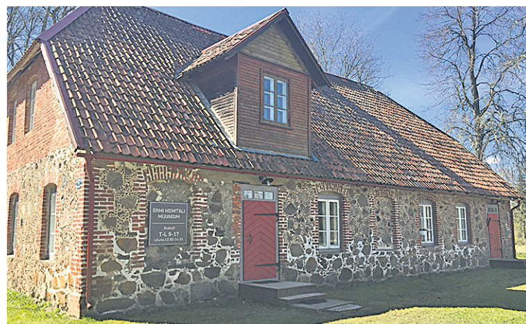
Eimtali muuseumi ja muuseumi ümmer jakkup muuseumiüül tege-mist tervele perele.

Latse saave mängi mede mängutuan ja õppi "rõõvarikmist" ek kangarükki rükipakkege. Muuseum, muuseumipuut, Mulgi kinnaste näitus "Mede raudvara om kinda!" ja Linnupette kohvik vana vallamaja man om sii õhtu valla kella kümneni. Näitusel om vaatemises vällän 72 õiget Mulgi kindapaari, mes om valmis tettu Eesti Rahva Muuseumi ja Villändi Muuseumi kinnaste perrä. Nii om kudanu Kudajide koopialubi liikme armastusest mede kindaperänduse vastu ja toetuses Raua Anu elutüüle ja suure süämege luidavele keskusele Eimtalinn. Kudajide koopialubi annetep kik koet kinda Raua Anu keskuse ääs. Välläpaneku valmissaamise