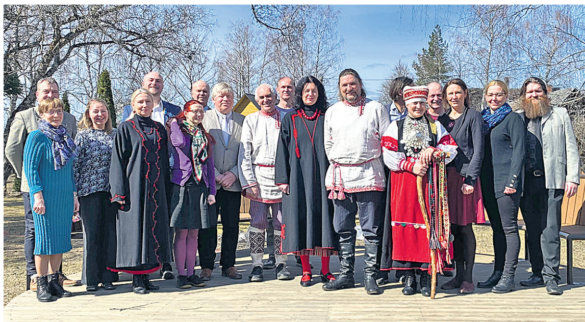
Värskasse ollive põlitside keelde aastekümme akatuses kokku tullu setu, võru, mulgi ja Kuusalu rannakeele iistvedäje.