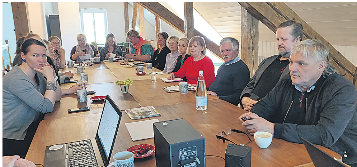
Mai algusen oli instituuti pikä lavva ümmer kokku tullu ulka mulke egäst Mulgimaa nukast, et arute, kudas ütenkuun mulgi asja edesi aade.

Sel aal, ku päeväst päevä rabati rasset tüüd tetä, oli egäüte pühä kohus pühäbe enge tõmmate. Puhati ja mõteldi oma mõttit, arutedi üleaidsidege,