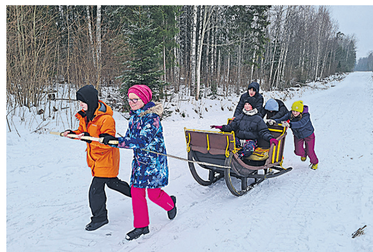
Kuna Mokalaada naise vastlepäeväs obest es levvä, tulli lastel endel kõrdamüüdä rege iist vedäde ja tagast tõugate.

Vastlekukle om uuempe aa süük, vanast kütsätedi kesväka- raskit. Vastle ollive jõuluaa lõpp. Süük sahvren akas otsa saama, selleperäst keedeti viil siajalgu ja erne- või uasuppi. Peräst vastlit akkap ju paastuaig.