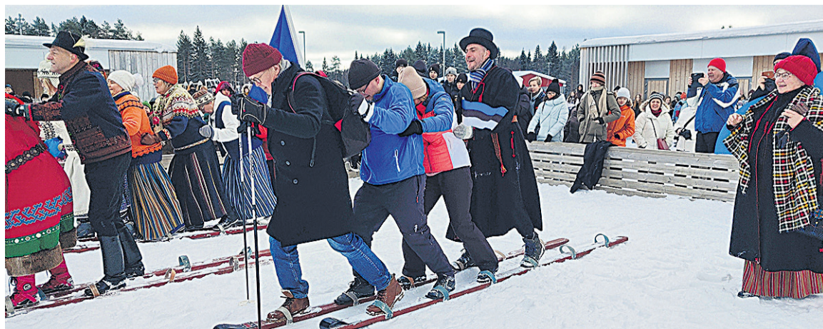
Ütenkuun jõvvp kaugembele. Üte suusapaari pääle mahtusi ulka soomeugrilasi.