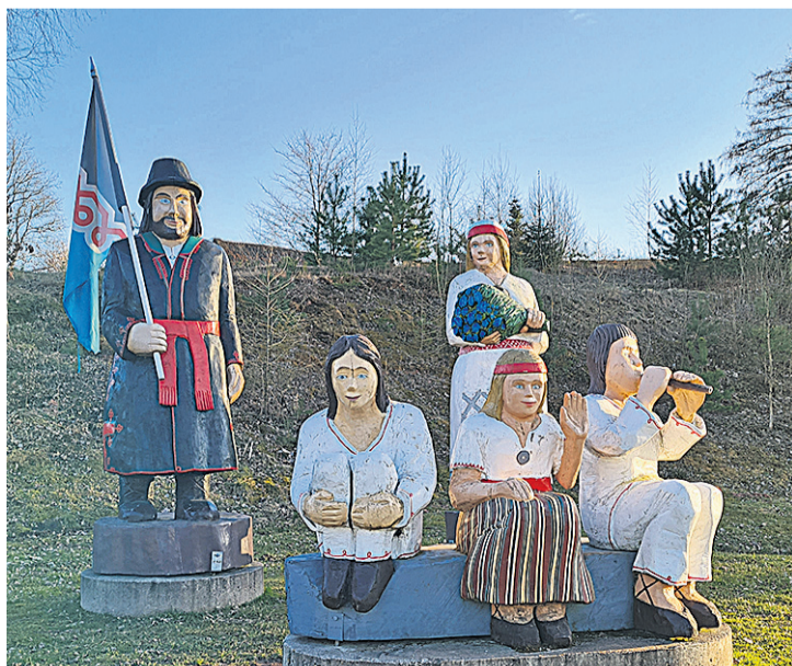
Puukujude kogu “Önnelik Mulgi pere” seisäp kunagise Taara iie vee- ren.

Hiite Maja SA juhateje Mulgi kiil: Ilves Kristi