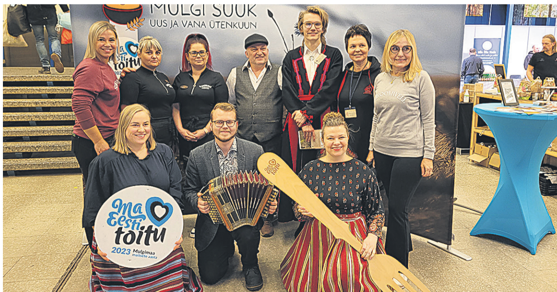
Mulke jakkusi päälinnan mitmese messiuunese, kus na paksive nii süüki ku vaimutoitu.