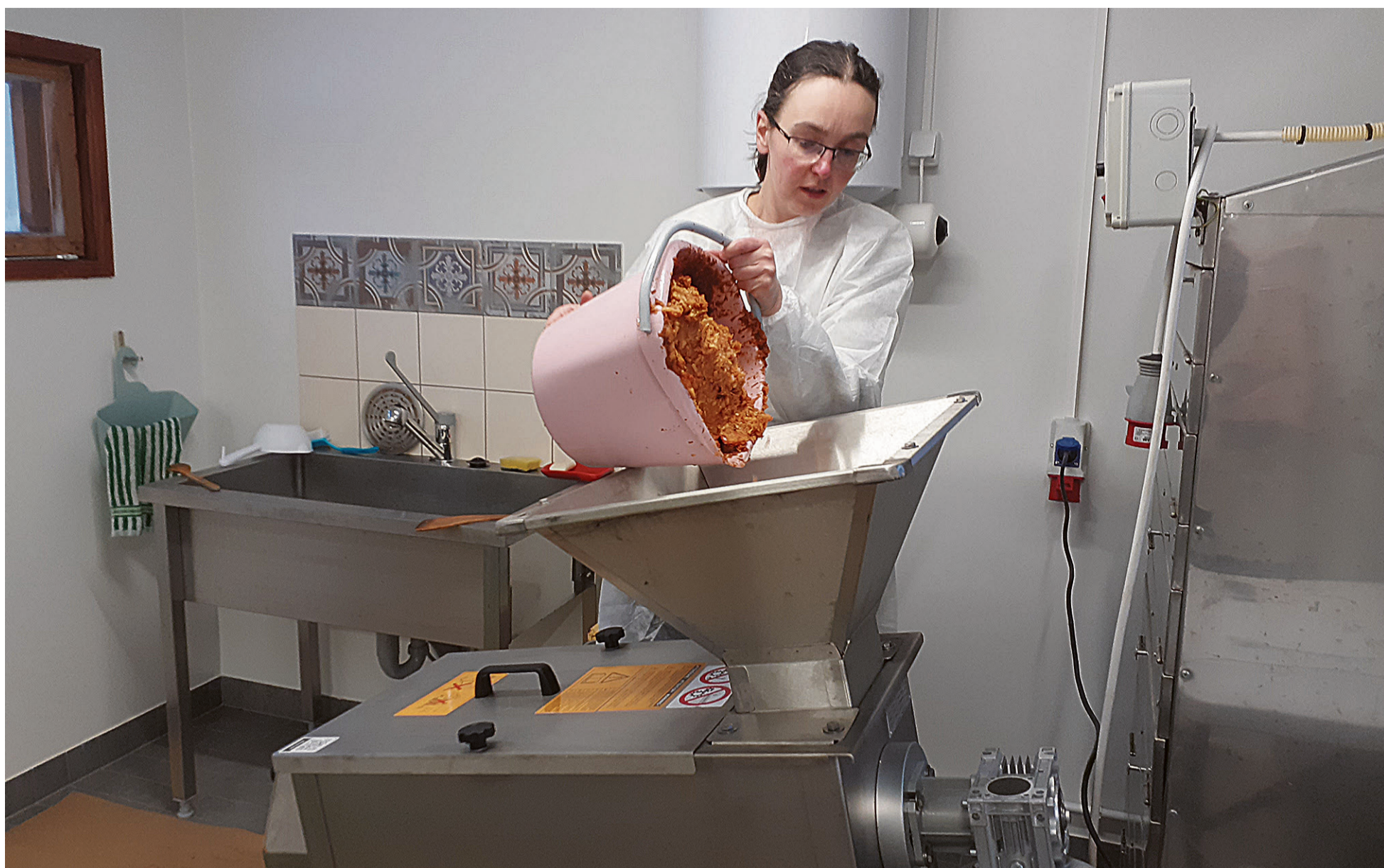
Pernaisel Järve Maril om ää miil uvve püreessi üle, mille sissi ta kaldap ubineveskest läbi käinu lödi ja vällä tulep säält joba puhas kommisegu.