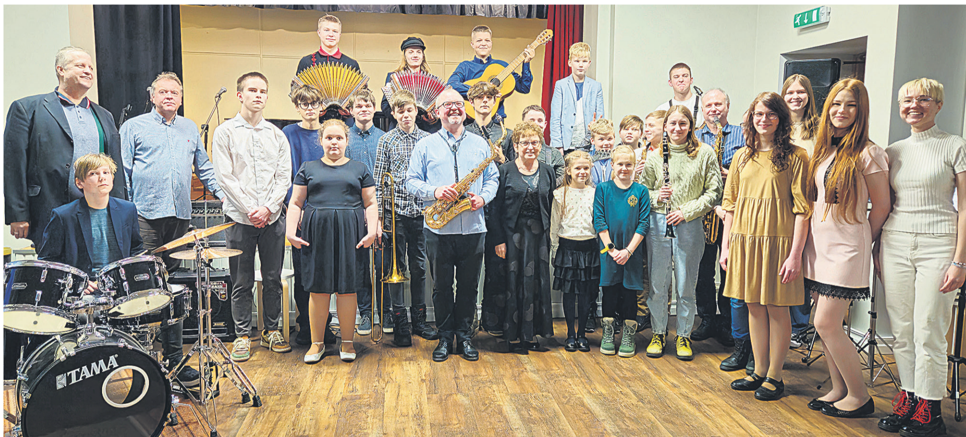
Mulgimaa nellä muusikakooli latse ja õpeteje saive 15. veebruaril kokku Tõrva muusikakooli saalin.