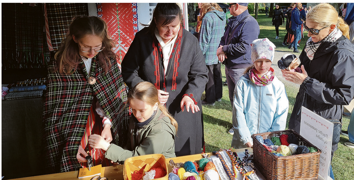
Mineve keväde käisive mulgi Mulgimaa perimuskultuuri rogrammi abige Talnan perimuspidul Baltica. Pildi pääl om Tarvastu käsitüükoaga paglapunumise tüükammer.

le ja kultuuri tegemiste, aalehe Üitsainus Mulgimaa välläandmise ja mulgi keele õpetemise jaos. Indaje arutive kavva, kas ja kudas toete kuule ja lasteaidu rojekte, kus küsti raha muuseumi käimises või õpperogrammi piletide ostmise jaos. Egä omavalitsus saap riigi puult kultuurirahitse raha (www.kul.ee/kultuurirahits), mis om just mõteldu muuseumi, näituste või tiatrepiletide soetemises. Selle raha saamises ei pia esiki rojekti kirjuteme egä peräst aruannet tegeme. Rahvarõövaste ostmise man tulep meelen pidäde, et meistrel, kelle käest rõõva tellites, piap oleme rahvarõõva- või tekstiilkäsitüü meistre tunnistus ja rõõva passitedes kokku MUIS-i näidiste perrä,” sellät Salmari ja üteli, et kiiduväärt om kah murdekiilse lugemisvara välläandmine. “Ku juba mulgikiilne Täheke om väikse latse lavva pääl, sis ei ole rasse kah aalehte Üitsainus Mulgimaa, Mul-