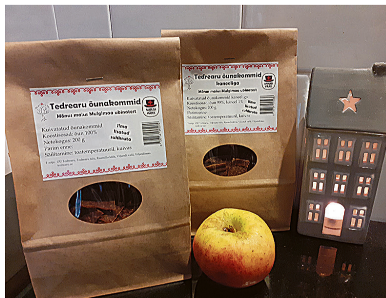
Tedrearu ubinekommi kannave uhkusege Mulgi märki.

Kommi jaos mösep Mari ubine kigepäält puhtas, sis jahvatep na vana kooli õunaveskege purus. Edesi lääp sii lödi läbi ressi, mis võtapp kik tüki vällä ja tekkup siande puhas segu. Selle panep ta suure potige puuliidi pääle tunnis aas tasatse tule pääle podiseme. Enne kiitmist võip manu panna viil midägi suuperräst, näituses kaniili – sis saap kaneelige õunakommi. Peräst tulep keedet segu küdsätamise papre pääle laiiali aade ja ümäriguld üüpäeväs kuivatemise masina reste pääle kujume pista.