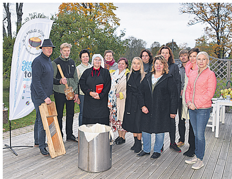
Ku kapuste saive tõnni, oli talgulistel aiga üteli pilt kah tetä.