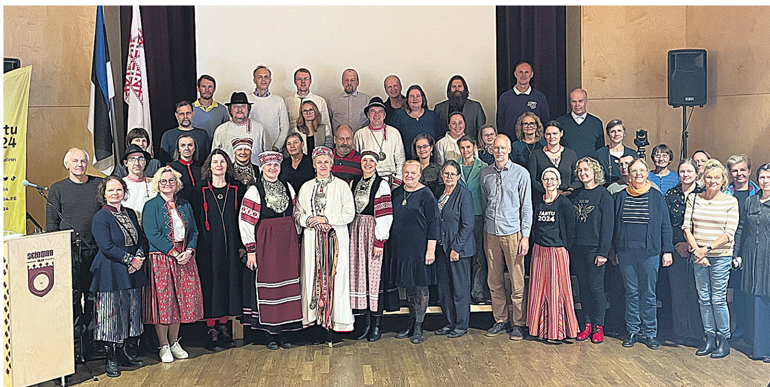
Oma keele oidjit ja kõnelejit oli Setumaale konverensile kokku tullu egäst Eesti veerest.