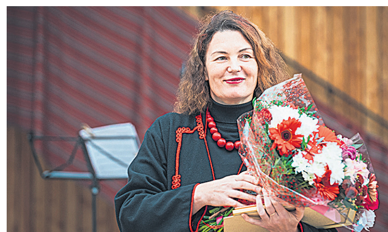
Mulgimaa Uhkus 2023 Ilves Kristi.

Selle täädmise om ta iluste kokku säaden raamatun “Minu