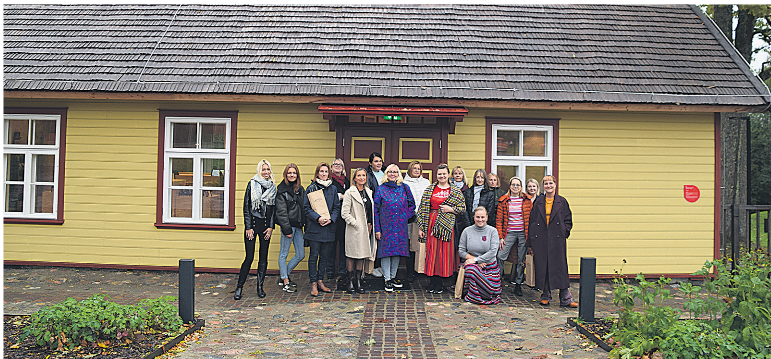
Söögiaakirjanige reispäevä sissi mahtusi Mulgi elämuskeskuse uvireis kah. Pilt om tettu äärbäni usse ihen.

Omaette toredus olli täpimajan käimine. Mäe-Koa pererahvas om sinna küläliste rõõ-