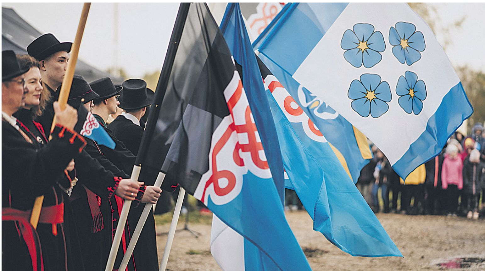
Joba ulka aastit koguneve mulgi 12. oktoobrel lippege Mustla pääle Mulgi Majaka manu.

“Täembe tähisteme Mulgimaa lipu päevä. Kümme aastet tagasi õnnistedi siin lähiksel Tarvastu kirikun sissi lipp, mille värvi tähistevä linaäitsme sinist, Mulgi kuvve musta ja valguse värvi valget. Punatse kaaruspaela viis sõlmi seove ütte Mulgimaa viis kihelkonda: Tarvastu, Elme, Paistu,