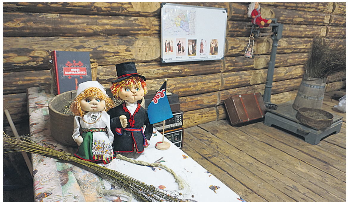
Lilli luudusmaja man om tore linaait, kos latse saave täädust Mulgimaast ja linakasvatusest ja kah esi linatüütetä.

20. märtsil kell 12 kõnelep mõtsloomaurje Männili Peep