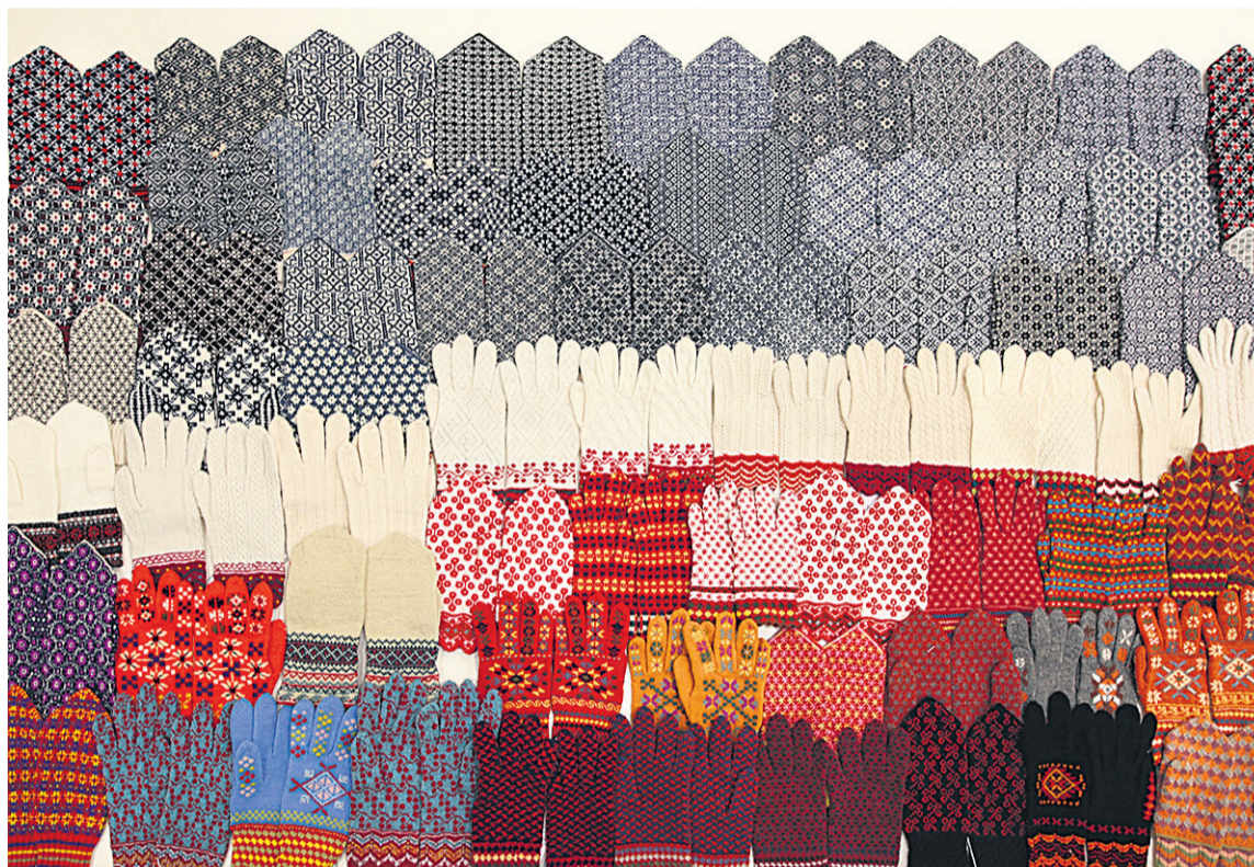
ERMin näitusel om vällän 72 paari Mulgi kindit, mille kudasive valmis 60 naist. Täpselt sama mustrege om neist pallalt paar paari.