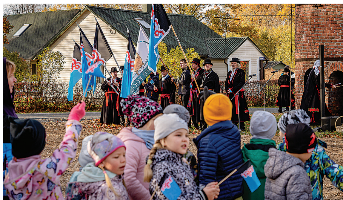
Mulgimaa lipu päev tõi Mulgi Majaka manu ulka suuri ja väiksit mulke, kigil lipu kähen.

Kuna sii aaste kannap Abja-Paluoja üteli kige Mulgimaa soome-ugri kultuuripäälinna nime, kõnelime siikõrd rohkemb kah õimurahvastest. Abjan olli 14. oktoobrel Ungari