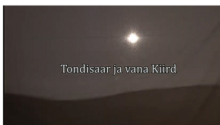
Tondisaar ja vana Kiird

Mulgi Kultuuri Instituudi välläanne Üitsainus Mulgimaa