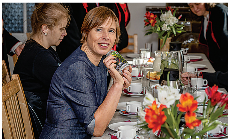
Kultuuripäälinna aastes pruulitu Höimlase ölu es jää esiki presidentiil tähele panemede.