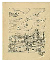
PAISTU KROONIKA 1831-1944

Vilmi saap kaia Mulgi Kultuuri Instituudi Youtube-kanali päält.