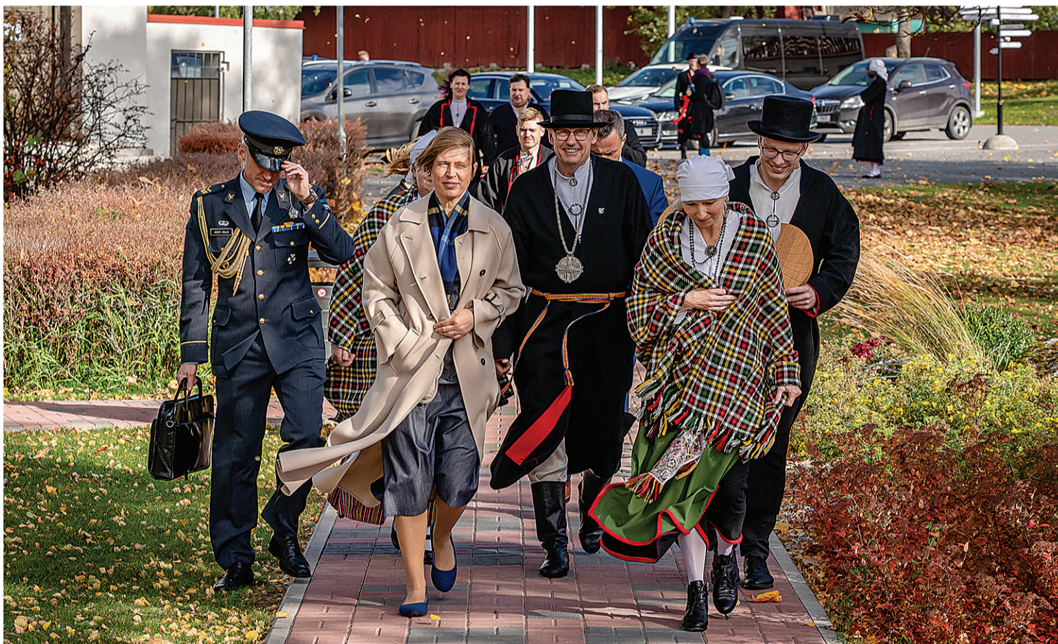
6. oktoobrel kõnd president Kersti Kaljulaid ütenu oma saatjide ja mulkest võõrustejidege soome-ugri kultuuripäälinna Abja-Paluoja.