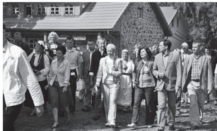
Presidendipaar ütenu vallarahvage käsitüükoa man.

Käsitüükoan näidati, kudas kangakudamine ja kaaruspaela tegemine käip. Ja usu vai ärä usu, presidendipaar olli väige uvitet sellest käsitüüst. Pilti tetti kah, mõtle, esiki mia sai pildi pääle!