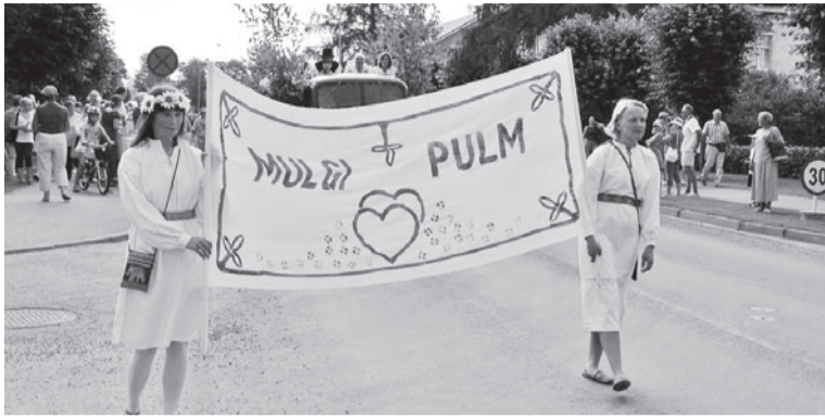
Mulke pulm ai Tõrva rahva uulitside pääle.