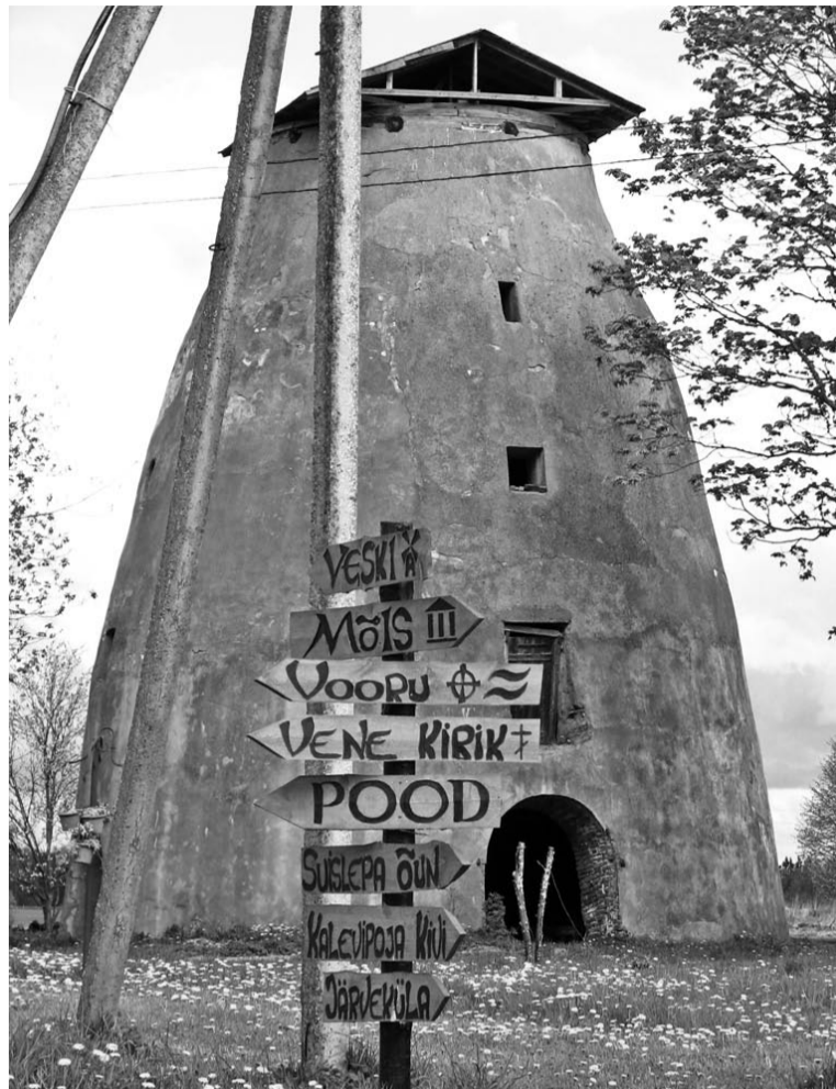
Suistle tuuleveske.

Sii, et akkajembe inimese lääve maalt ärä, ütten nendege kaos luutus uute tüükotuste manutulekust. Peräst lääve