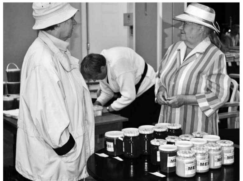
Linnumagust osteti ja müiti tubliste.