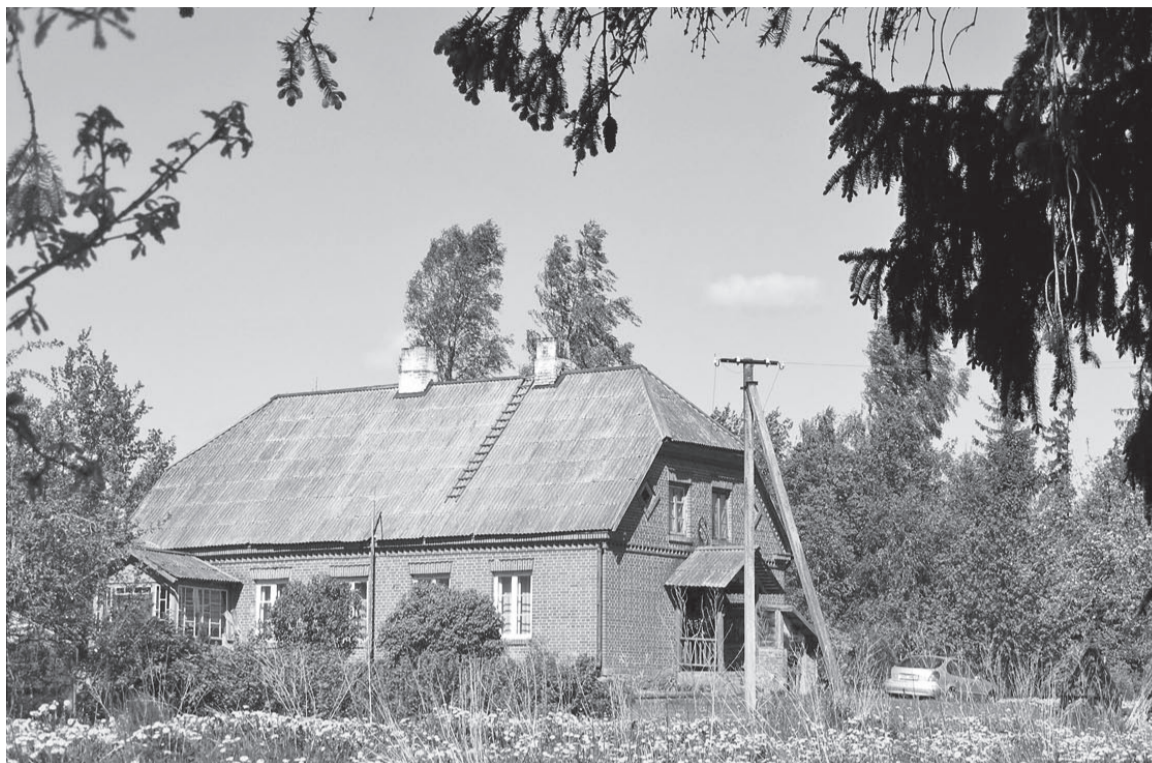
Endine Õisu vallamaja.