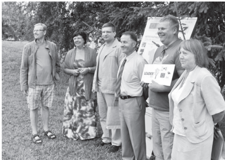
Kokkusaamine Panevezise Leader-grupige.

Panevezise grupp lubas 2012 aastel meile küllä tulla ja osavõtta mede 2012. aastel konverentsist.