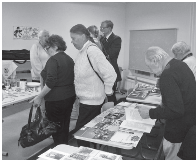
Mulke Seltsi vällapanek panni mulgi vanu aigu miile tuleteme.

Üten klassituan olli meil üles säetu Mulke Seltsi vällapanek. Sääl