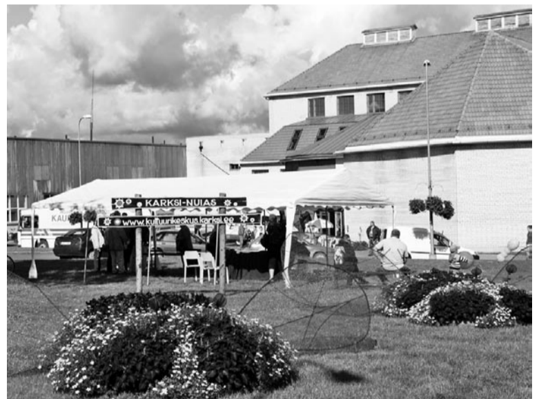
Lillist mesilinnu Karksi kultuurikeskuse man.