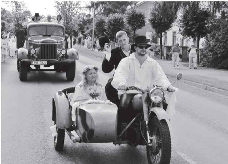
Pulma jaos ollive käima säetu vanaaigse sõiduriista.

memmekside tantsurühm Eideratas. Ku pruut tagasi tullu ja ütenkuun levveti, et ta olli kik äste ostnu, läts pulmarong uvveste liikvele. Kõnniti ümmer bussiuutmise platsi laulden ja naarden. Rahvas vaadas päält ja plaksut.