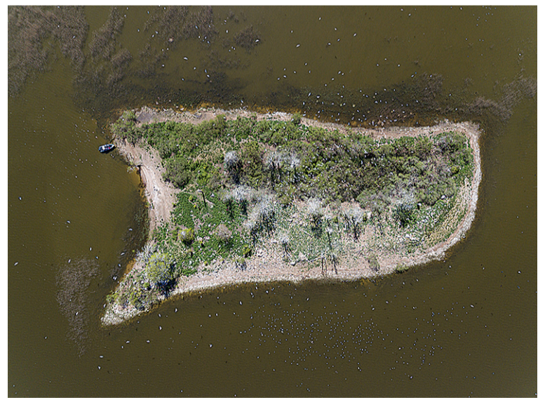
Talvik Joonase Tondisaare pildile "Jutumull saarest" anti luuduskaitse eripremia.