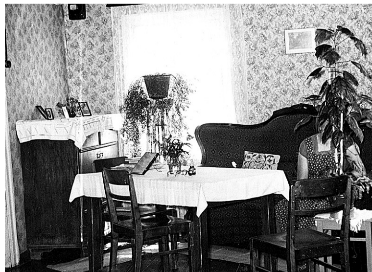
Umbes siandsit asju otsip luudav Mulgi Elämuskeskus oma kogu jaos. Pildi pääl om Timpka elumaja kammer.