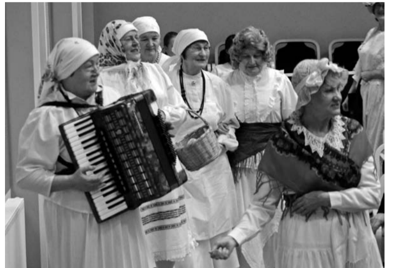
Kadrilauba ollive muduki kadrisandi rahvatantsurühmüst Kadri kah latsin.

esi sellätive, kudas üits või tõne asi valmis tetti. Kes taht, sai õpetuse kodu ütten. Jõusime kõnelde lihaleväst, mulgikorpest ja mulgipudrust. Polli pernaiste Helju Juhkami ja Sinaida Taali käe all teime perämine kõrd esi verivorste. Selle tüü manu käis põhjalik õpetus kah, kudas ja kunas midägi tetä. Vorsti saive küll väige ää.