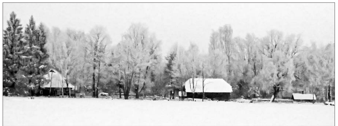
Ku puu om enne jõulu ärmän, tulep tõine aaste lämi sügüs.

Ku üüse om kuu ümmer valguse sõõri, sis om lähembil aigul külmä luuta.