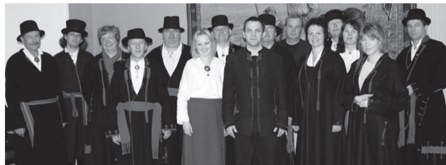
Mulgi usuve, et ku minnä sedäsi ulgandi sõna viimä, sös om sel rohkemb kaalu kah.

Mulgimaa valla- ja linnajuhi käisive 14. novembrel valla- ja linnaelä-nige nimel riigiesädele tähtsat paperd viimän. Na küsseve mede kandi elu edesiviimise jaos tuge, midä võis anda Mulgimaa arenguprogramm. Riiklik programm avites Mulgimaa kultuuri-perändust ja murdekiilt alla oida ja elu siin kandin edesi viia