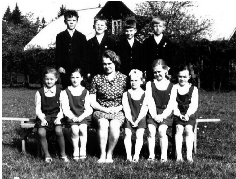
Elve 1969. aastel ütten Toomesoo kooli I lassi lastege.

Siu abige om Karksi vald saanu manu ää ulga raha. Küll külämajade remontmise ja sis-