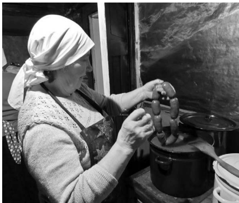
Elmingu Maimu panep vorste kiimä.

Ku puder valmi, segäsime kokku liha ja maitseaine. Egän