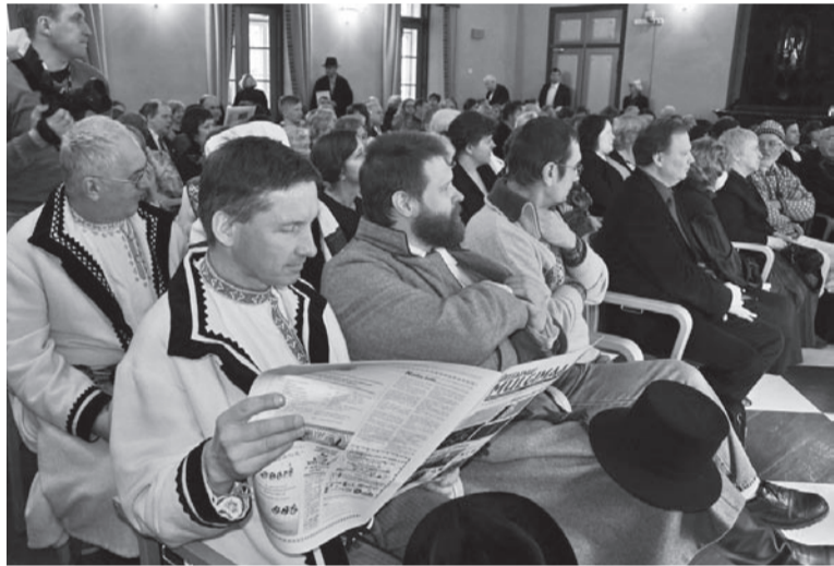
Setumaa külälise lugeseive imuge mede mulgikiilset aalehte.