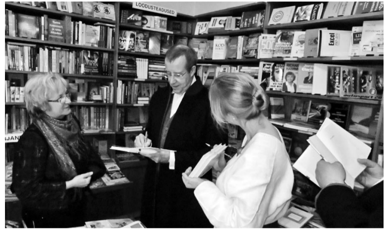
Pallude lasseve presidendil oma vast ostetu mulgi sõnastikku sissi kah kirjute.

Mulkidena oleme kõik rõõmsad, et sellel aastal saime valmis oma sõnastiku. Mulgi sõnastik aitab meil oma keelemurret hoida ja arendada ning mis väga tähtis – mulkidele endilegi kaduma kippunut meelde tuletada ja noorematele õpetada. See teeb kogu Eesti kultuuriruumi palju rikkamaks ja aitab mulkidel paremini hoida meie omapärasid Mulgimaad, kus mulgi kuue ja mulgi hääberberi kõrval kuuleb üha enam mulgi keelt.