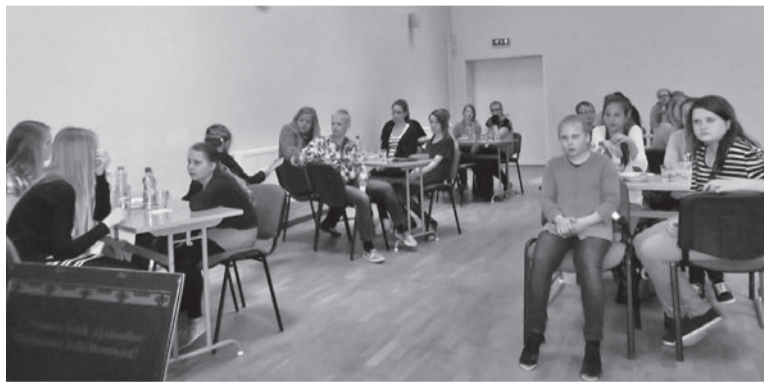
Karksi-Nuia täadmistepruuvile tuli kokku 36 Mulgimaa koolilast.

Küsimuse ollive seot Mulgimaa, mulgi keele ja kultuurige ning siit täädatunt inimestege. Näituses pidive latse täädma Mulgimaa präegutsit omavalitsusi ja endisit kihelkonde, tundma pildi päält ärrä Anu Raua ja Taagepera lossi, mõistma raasike mulgi kiilt ja täädma vast valitu mulgi lippu. Küsimusi olli kokku 24. Vastussit innati katen jaon: 4.-6. lass ja 7.-9. lass. Võistelus olli äste tasa-