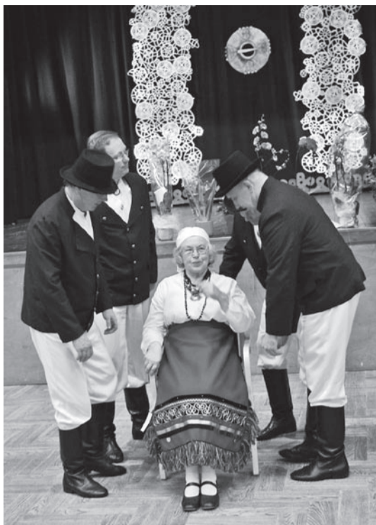
Lille-Astra Arraste austemise õhtu Karksi valla kultuurikeskuse. Kohe tõstave Sõlesepa mihe juubilari lae ala.

Sedä laati "Linakasvatusest Karksi kandin" saap osta Karksi kultuurikeskusest, ku annade oma soovist täädä Annelile