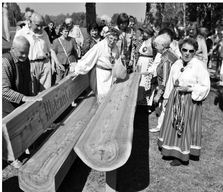
Pen`k Alliste kooli man uut inimesi istma ja kooliaiga miilde tuleteme.

Kui kik ollive ärä söönu, minti busse pääle ja sõit läits Alliste rahvamaja manu, kos