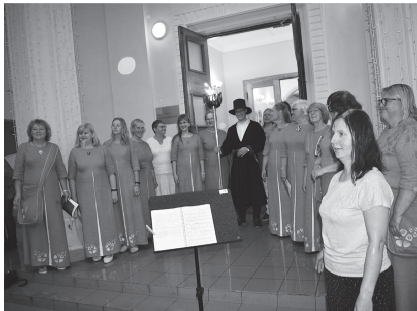
Vihmä käest jõudse tuli Abja kultuurimajja, kus võtt tedä vastu naiskuur Öbe-äidsme.