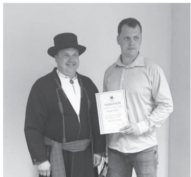
Mulgi vällän Kaarli külän asutet TransMovers pakup kolimise- ja veoteenust nii inimestel ku ettevõtetele üle Eesti.