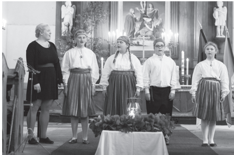
Pidutuli Paistu kirikun, laulave Paistu kooli noore ütten oma õpetejege.

13. ja 14. juunil sõitse XXVII laulu- ja XX tansupeo „Minu arm“ tuli, mes ürgjati 1. juunil Tartun, läbi Mulgimaa ja tõi pidutuju ja -sõna kigile. Tuli jõud 13. juuni ommuku Paistu kihelkonda, kust sõit edesi Tarvastuse ja jõudse õhtus Karksi ja Alliste kanti. 14. juunil olli tuli Elme kihelkonnas.