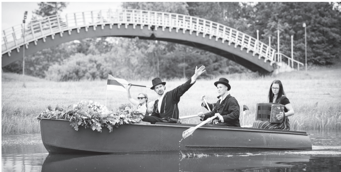
Tõrvan sõitse pidutuli Kaarsilla mant tõrvaahju manu uhkeste ehit paadige.