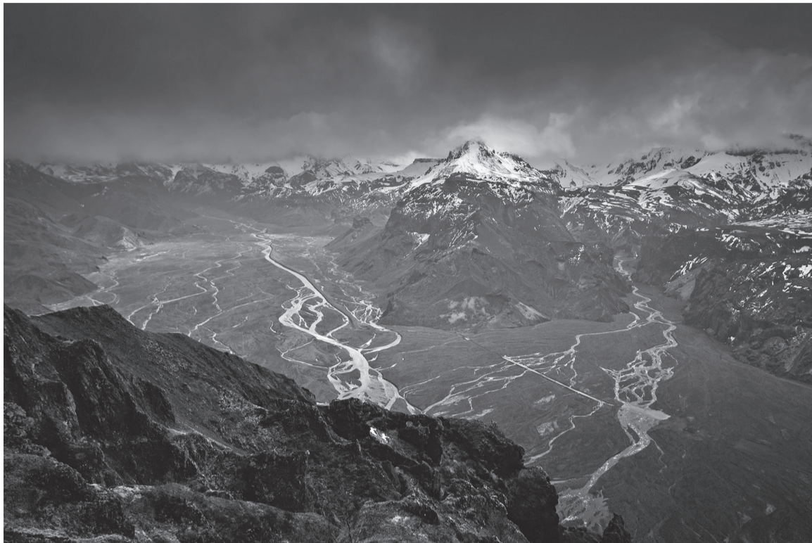
„Võimas luudus“ tõi Mändlale mailma kige suurembel päeväpildivõistelusel edimese kotusse. Pildi pääl om vaade Valanhukuri mäe tipust Thormorkin Islandil.