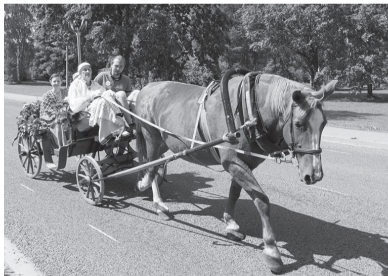
Läbi Mustla sõitse pidutuli obesevankrege.