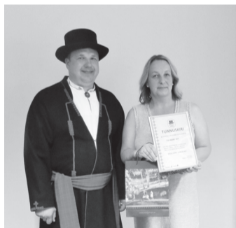
Maire Riit õmlep Tõrva vällän Ummulin linatsest kangast rõõvit ja tiip massinage sinna pääle vanu mulgi mustrit.