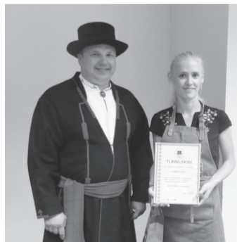
2017. aastel luudu BodyFood tiip Saarepeedil rüäkama, mille sissi pandas päähklit, siimlit, marjapulbrit ja rohueinu.