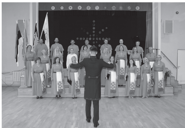
Pidupäeväl ast üles kah viieaastene Mulgi segäkuur, kes suvel edimest kõrda laulupidule lääp.

Suvistepühä akas meil ommukukohvige Mustla kohvipoodin, kokku olli tullu sadakond seltsi liiget üle Eesti. Ütenkuun kõnniti Mulke seltsi tamme manu, mes istutedi 2017. aastel Tarvastu tammeparki. Tarvastu käsitüükoaga tüüdest ja tegemistest kõnel Aili Anderson.