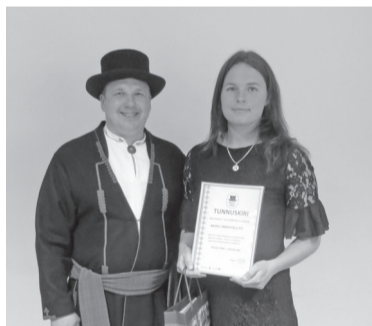
Aaviku Marjatalu om luudu 2017. aastel. Talu kasvatep Tarvastu külän Villändi vällän astelpajumarju ja tiip neist mahlu-muuse.