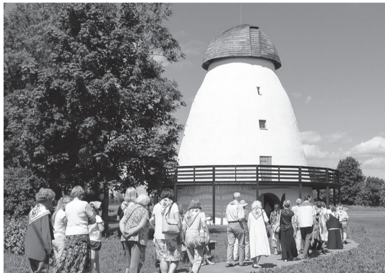
Seltsi rahvas käis Suistlen vaatemen, kudas nuur pererahas om vanast lagunu veskest ilusa kohviku tennu.

Joba aastit om Mulke seltsi rahvas saanu suvistepühäde Jaal kokku kihelkonnapäeväl. Siikõrdne kokkusaamine Tarvastun olli esierälik, sest tähistedi seltsi 85. aastepäevä.