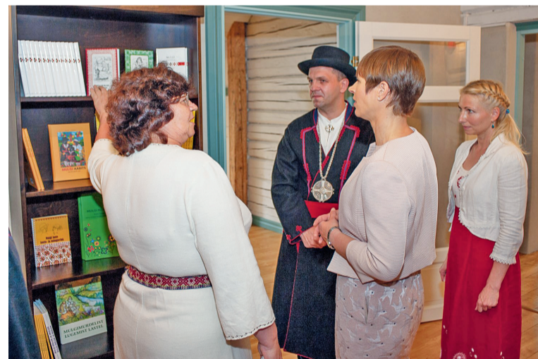
Alli Laande näidäs presidendil mulgi kirjavara.