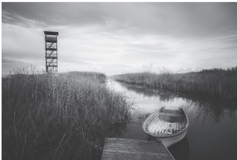
Tarvastu poldre vaatetorn.