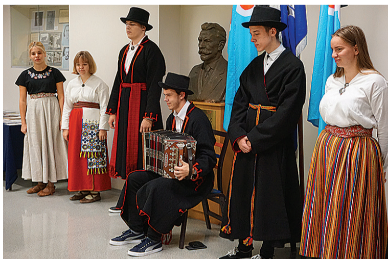
Kitzbergi gümnaasiumi mulgi.

mustrit. Kärstne maja latse teive endel esi Mulgi lipu ja lätsiv sis nendege paraadile. Lõpetuses küdsätive ja seive na Mulgi korpi.