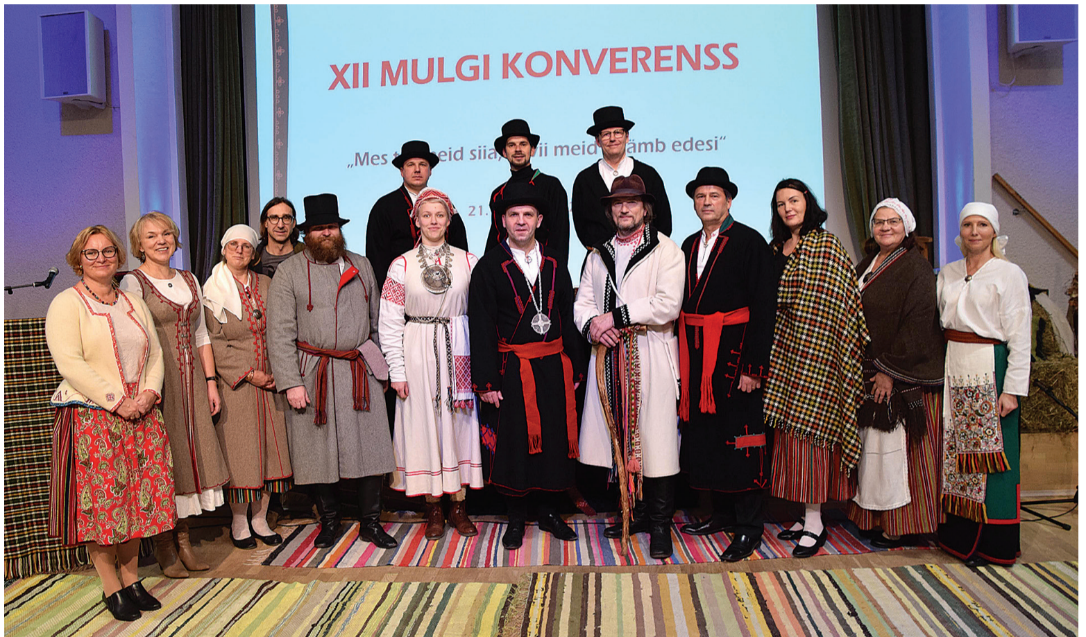
Konverensile ollive tullu kah omakultuuri oidje Kihnust, Võrumaalt ja Setumaalt. Na tullive kah mulkege ütitse pildi pääle ja sööriklavva ümmer, et arute, kuda ütenukun edesi minna.

Konverenssi kõrraldemise man ollive abis Mulgimaa ettevõtja, koolilitse, muusikamehe, käsitüülise ja ulka muud rahvast. Näituses sai konverenssi aal osta ja näta Mulgi käsitüüd ja süüki. Ettekanne te vahepääl näidati Tarvastu gümnaasiumi meedialassi õpilaste tettu vilmijupiksit ja päeväpilte Mulgi lipu päevä tähistemisest. Konverenssi saali eht Tarvastu käsitüükoda. Ääd kikkaseendeged suurmeputru