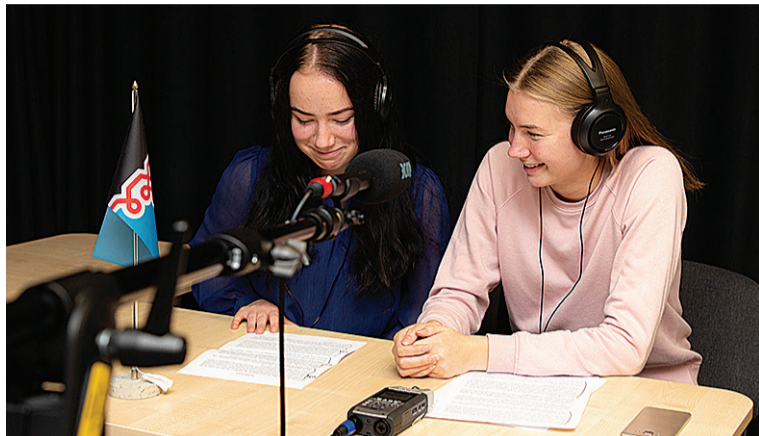
Abja gümnaasiumi raadjusaade.

Tarvastu gümnaasium tähist päevä Mulgi Majaka man mulgikiilside ülesastmistege ja kõnege. Tarvastu lasteaian lauleti mulgikiilside laule, tantsiti ja joonistedi Matatalabige