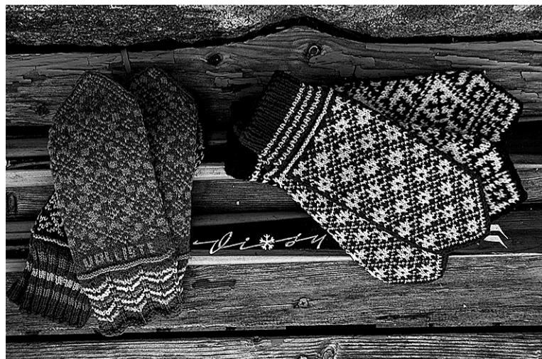
Mulgikirjalise kinda om ilusa ja neil om vägi sihen.