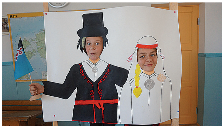
Paistu kooli pildisein.