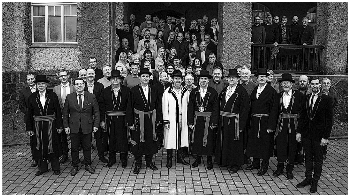
Tõrva, Mulgi ja Villändi valla volikogude saive Taageperä lossin kokku ja arutave, kudas Mulgi asja üttenkuun edesi viia.

20. novembrel koguni-ve Valgamaal Taageperän kigi kolme Mulgimaa omavalitsuse volikogude liikme, et arute üttenkuun Tõrva valda Sooglemäele luudave Mulgi elämuskeskuse asja ja mõtelde, kudas parembini kuuntüüd tetä.