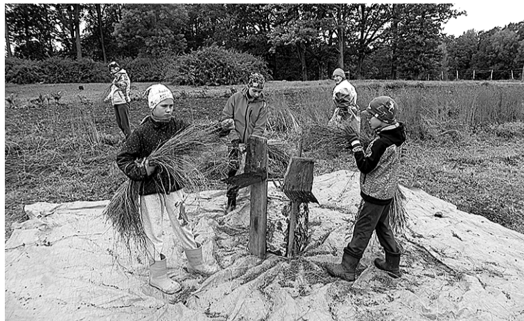
Ku lina om maast üles kakut, tulep ta kohe kupardest puhtas rabade, kupra kokku korjate ja ärä kuivate, et uut linaseemet saia.